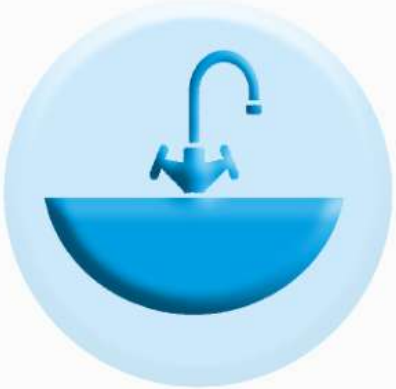
РАКОВИНЫ И СМЕСИТЕЛИ