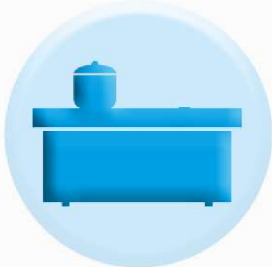
ПОВЕРХНОСТИ СТОЛЕШНИЦ, ПОЛОК