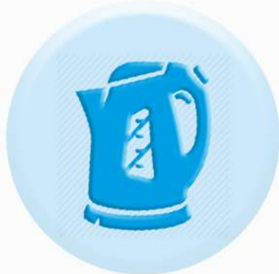
КНОПКИ БЫТОВЫХ ПРИБОРОВ