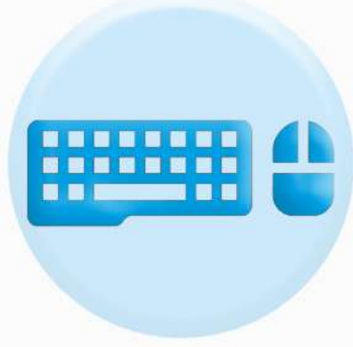
КЛАВИАТУРА ОРГТЕХНИКИ И МЫШКА