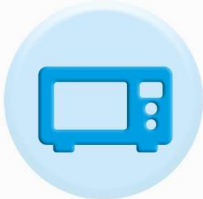
ПАНЕЛИ БЫТОВОЙ ТЕХНИКИ